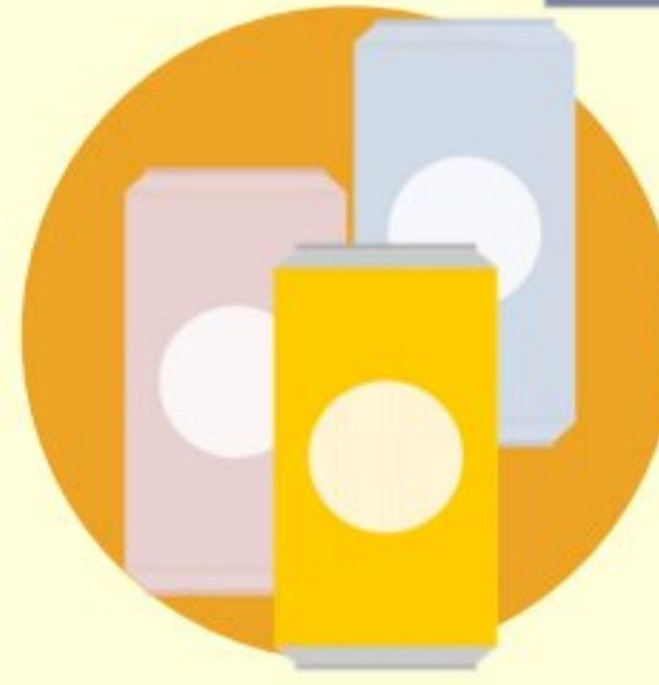
กระป๋อง เครื่องดื่ม อะลูมิเนียม