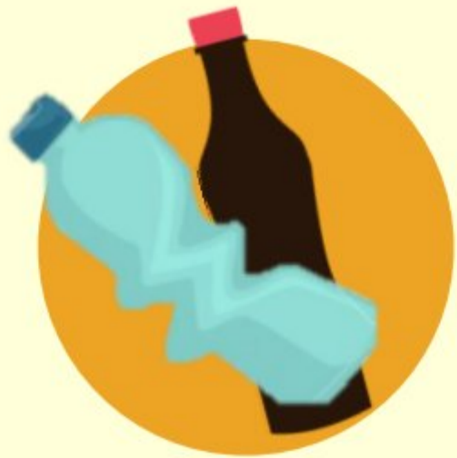
ขวดพลาสติก